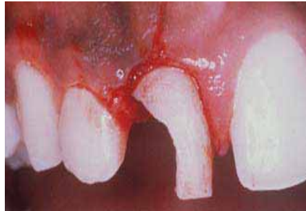
Avslagna tänder är en onödigt skada inom hockeyn. Forshaga Dentaldepå säljer Scheus tandskyddsplatta Bioplast, som finns i många olika utföranden.

Enligt en undersökning rör sig en framtand 8,63 mm vid ett slag av 20 kilo om man inte använder skydd. Vid användning av gör-det-